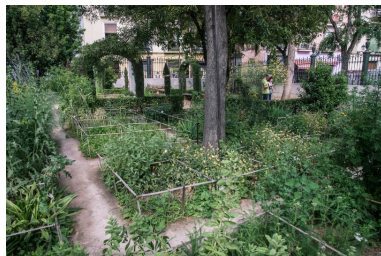
Panorámica de la colección de plantas medicinales

En este cuadro está el centenario ginkgo del jardín, introducido en este lugar en 1889, seguramente por el carácter comestible de sus semillas. Un azofaifo ( Ziziphus jujuba ) y un acerolo ( Crataegus azarolus ) representan antiguos frutales tradicionales hoy ya raros y en desuso.